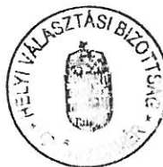
Dombóvári Rita HVB elnöke